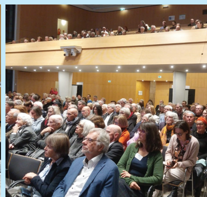
Gut besuchte Eröffnungsfeier im Großen Sitzungssaal des Stuttgarter Rathauses