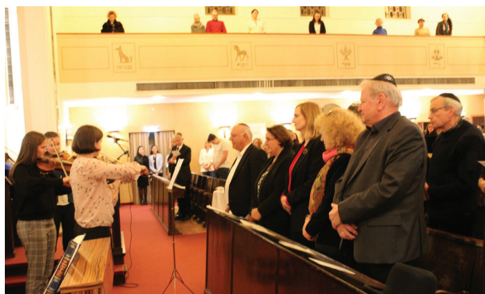
Beitrag von Schülerinnen der Freien Evangelischen Schule Stuttgart zum Gedenken an die Reichspogromnacht.