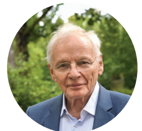
Prof. Dr. Götz Aly

Prof. Dr. Götz Aly ist Historiker und Journalist. Er arbeitete für die »taz«, die »Berliner Zeitung« und als Gastprofessor. Seine Bücher werden in viele Sprachen übersetzt. 2002 erhielt er den Heinrich-Mann-Preis, 2003 den Marion-Samuel-Preis, 2012 den Ludwig-Börne-Preis. Bei S. Fischer erschienen von ihm u.a. 2011 »Warum die Deutschen? Warum die Juden? Gleichheit, Neid und Rassenhass 1800-1933« sowie 2013 »Die Belasteten. ›Euthanasie‹ 1939-1945. Eine Gesellschaftsgeschichte«. Im Februar 2017 erschien seine große Studie über die europäische Geschichte von Antisemitismus und Holocaust »Europa gegen die Juden 1880-1945«. Für dieses Buch erhielt er 2018 den Geschwister-Scholl-Preis.