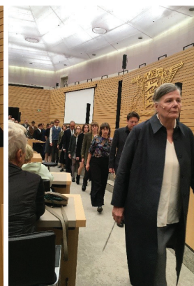
Schauspieler nach der Aufführung