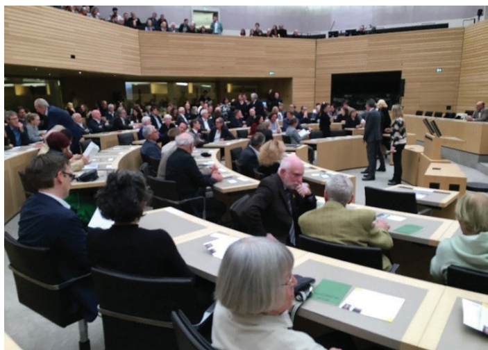
Zuschauer bei der Premiere des Theaterstücks „Die Ermittlung“ von Peter Weiss am 30. September 2025 im Landtag von Baden-Württemberg

Im Dezember 1963 brachte Fritz Bauer den ersten Frankfurter Auschwitz-Prozess gegen die „einfachen Ausführenden“ des Konzentrationslagers Auschwitz auf den Weg. Unter den Prozessbeobachtern befand sich der Dramatiker Peter Weiss, der daraufhin das dokumentarische Theaterstück Die Ermittlung schrieb. Es handelt sich dabei nicht um ein traditionelles Drama, sondern um Dokumentartheater: Der Text besteht fast vollständig aus echten Gerichtsprotokollen, Opferzeugnissen und Anklagereden. Die Uraufführung fand am 19. Oktober 1965 zeitgleich in 15 Städten Europas und der USA statt, darunter in Frankfurt am Main, Berlin, London, New York, Warschau, Stuttgart (Staatstheater – Regie: Kurt Hübner) u.a. Weiss und seine Kollegen wollten die Aufführung zu einer Art „europäischem Tribunal der Erinnerung“ machen, sodass das Stück nicht als lokales deutsches Ereignis, sondern als internationaler Akt des Gedenkens an den Holocaust und als Beitrag zur Erinnerungskultur verstanden werden konnte. In diesem Zusammenhang erinnern die Worte von Fritz Bauer, die er vor 60 Jahren sprach: „Nichts gehört der Vergangenheit an, alles ist noch Gegenwart und kann wieder Zukunft werden.“ Gerade deshalb erwies sich die neue Inszenierung des Stücks als außerordentlich aktuell.