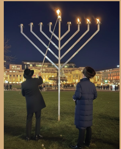
Lichterzünden in Stuttgart.

Sonntag, 21. Dezember um 17.30 Uhr in Ulm vor dem IRGW-Gemeindezentrum am Weinhof