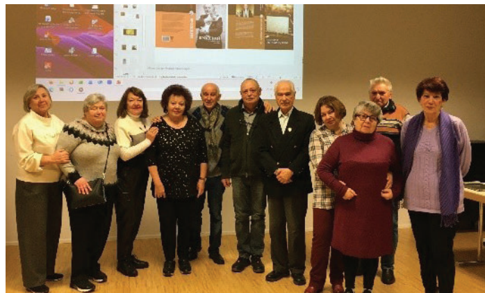
Nach der Präsentation - im Hintergrund zwei Bücher des Autors

понимание и знание. В текстах Пушкина и Цветаевой встречаются два ключевых понятия – мудрость и знание, но отсутствует понимание. И только в текстах Бродского встречаются все три ключевых понятия! Автор прочитал стихи Бродского с их упоминанием и были представлены две книги Марка Яковлева о поэте: «Бродский и судьбы трёх женщин», изд. АСТ, 2017 и «Одиссея кота Бродского», изд. АСТ, 2019.