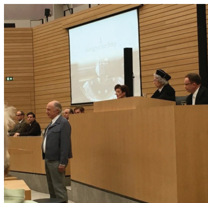
Aussage des 1. Adjutanten des Kommandanten

В декабре 1963 года Фриц Бауэр инициировал первый Аушвиц процесс против «простых исполнителей» концлагеря Освенцим. Среди публики на процессе был драматург Петер Вайс, который написал документальную пьесу «Следствие». Это не традиционная драма, а документальный театр: текст составлен почти полностью из реальных протоколов суда, свидетельств жертв и обвинителей.