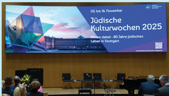
Offizielle Eröffnung der Jüdischen Kulturwochen Stuttgart 2025 am 3. November 2025 im Stuttgarter Rathaus