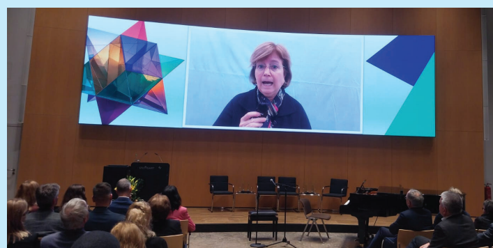
Mit einem Grußwort zugeschaltet: Generalkonsulin des Staates Israel Talya Lador-Fresher