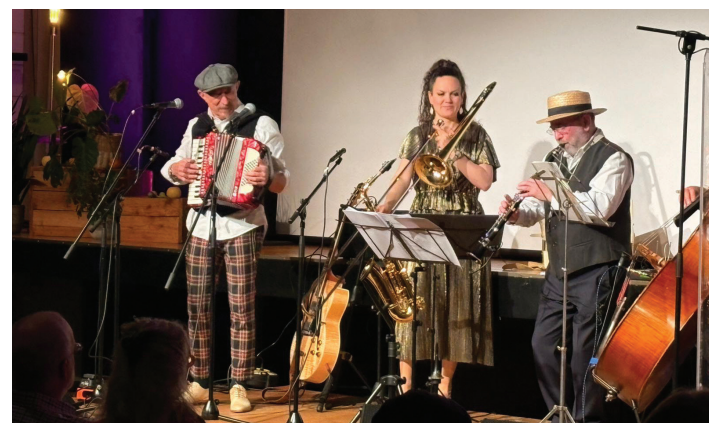
Jüdische Kulturwochen Stuttgart 2025: Klezmerkonzert mit Rosenthal & Friends am 6. November 2025 im CVJM Stuttgart.