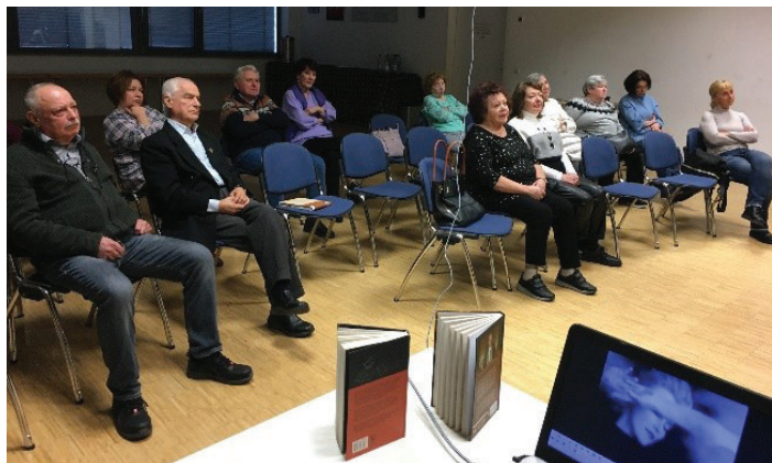
Zuschauer während der Präsentation