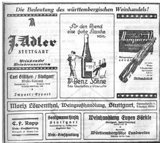
Anzeigen in der Württembergischer Zeitung vom 6.12.1926 (Württembergische Landesbibliothek Stuttgart)

Zahlreiche Weingroßhandlungen in Deutschland wurden seit Ende des 19. Jahrhunderts von jüdischen Unternehmern geführt. Dies war auch in Württemberg der Fall. Hier erinnert heute nichts mehr an die jüdischen Weinhändler – nach der Machtübernahme durch die Nationalsozialisten wurden sie ausgegrenzt, verfolgt, vernichtet.