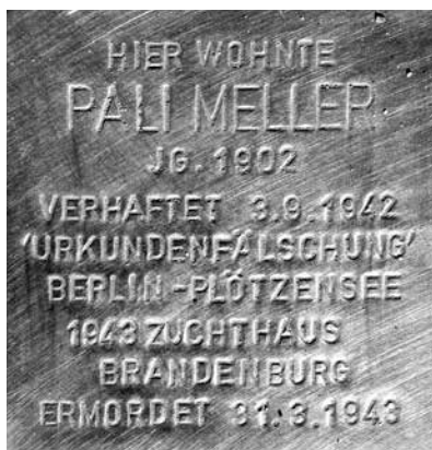
Stolperstein für Pali Meller in Berlin-Westend, Knobelsdorffstraße 110

In der Lesung werden die humorvollen und herzerreißenden Briefe aus dem Gefängnis ergänzt durch einige Briefe aus der Bauzeit der Weissenhofsiedlung.