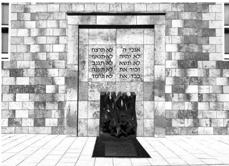
Neue Synagoge Stuttgart

ÖPNV: Haltestelle Stadtmitte oder Berliner Platz/Hohe Straße