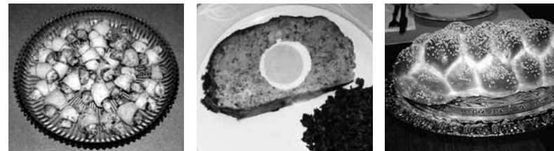
Koschere Speisen von links nach rechts: Rugelach, Gefilte Fisch, Challa

Entlang des jüdischen Feiertagskalenders werden die Bedeutung der Feste, Hintergründe und Brauchtum vermittelt und die typischen Gerichte vorgestellt. Sie können dabei gleichzeitig verköstigt werden. Auf diese Weise erhalten alle Interessierten einen besonderen Zugang zum Judentum.