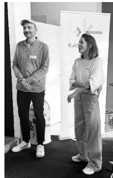
Expertinnen und Experten bei einem BarCamp zur Vorbereitung der Ausstellung

Veranstalter: KulturRegion Stuttgart e. V. / Landeshauptstadt Stuttgart, IRGW | Eintritt frei