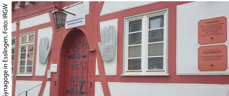
Synagoge in Esslingen.

In Kooperation mit NIGUN Internationale Musikakademie e.V.