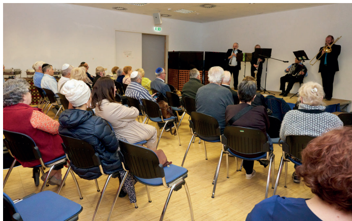
Lag baOmer Konzert im Ulmer Gemeindezentrum