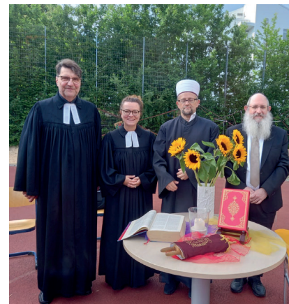
Multireligiöse Feier am 27. Juni in der Spitalhofschule Ulm