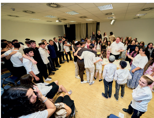
Jugend-Schabbaton in Ulm mit Besuch jüdisch-amerikanischer Jugendlicher