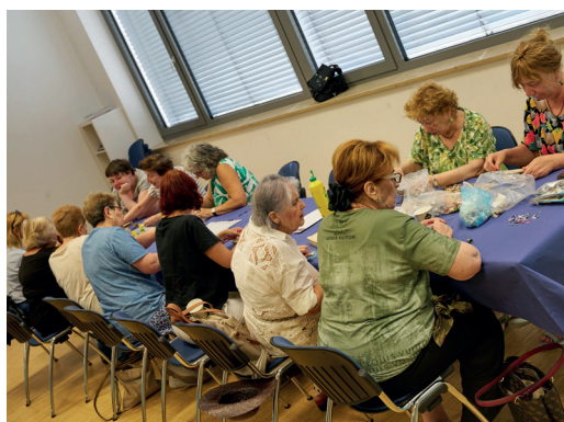
Aktivitäten unseres Ulmer Frauen-Clubs