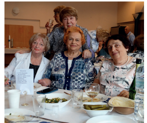
Gute Stimmung bei den Gästen