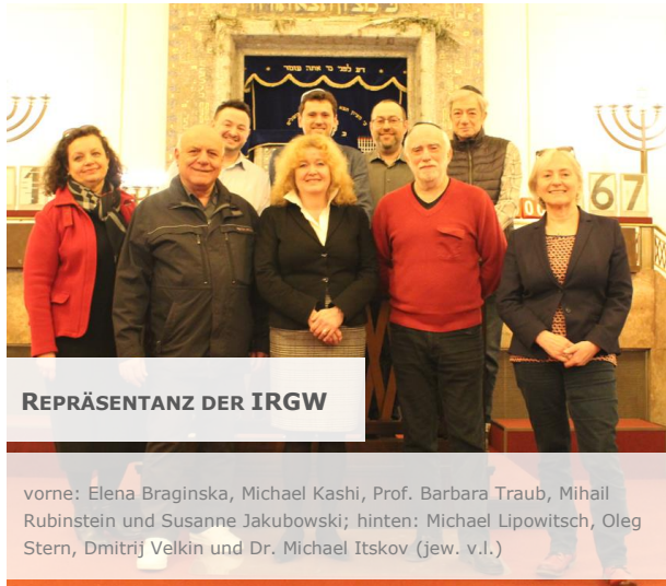
REPRÄSENTANZ DER IRGW